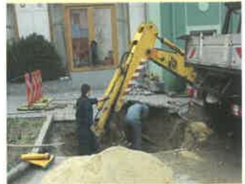
Der Rohrbruch konnte dann rasch behoben werden.

Letztendlich wurden die Arbeiter fündig, der Rohrbruch befand sich in der Hauptstraße beim Kräuterzentrum, wo der Parkplatz bzw. auch der Gehsteig aufgedigelt werden musste. Nun kann der Sommer kommen, denn da wird das Wasser ohnehin des öfteren knapp.