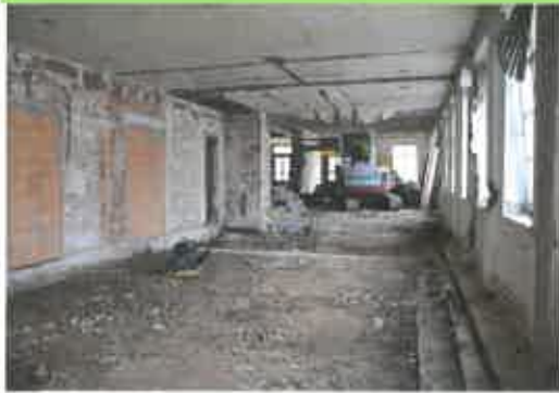
Hier waren noch Bagger und schwere Maschinen am Werk.