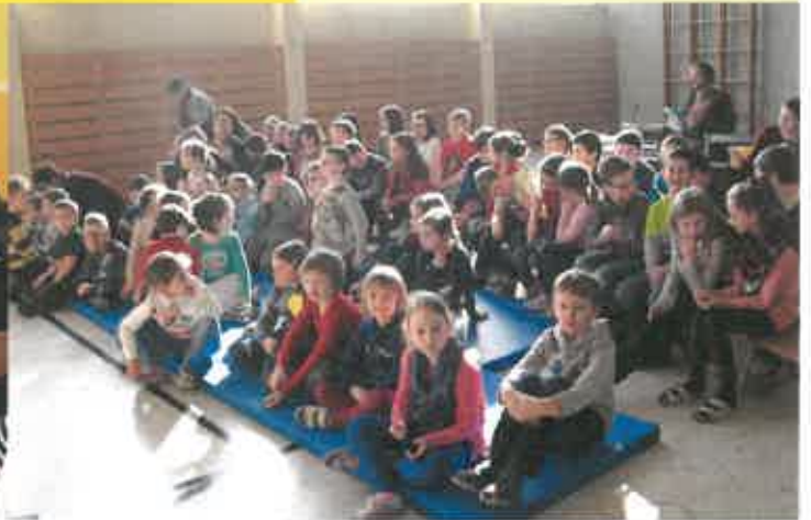
Das Theaterstück wurde im Turnsaal aufgeführt.