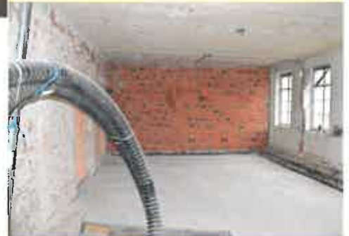
Die groben Arbeiten im Inneren sind nun schon abgeschlossen.

Die Übersiedlung in die neuen Räumlichkeiten des Gemeindeamtes und des Bürgerservices ist im Sommer geplant.