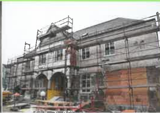
Auch mit den Arbeiten an der Fassade wurde bereits begonnen.