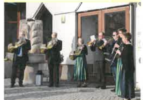
die Rossinger Musikanten