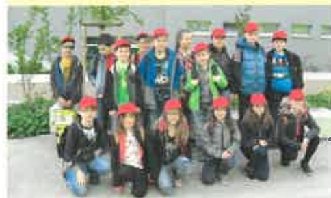
Ausflug nach St. Pölten

Am 25.4. unternahmen die 3. und 4. Klasse der VS Karlstein eine Exkursion in die Landeshauptstadt St. Pölten. Zu Beginn stand eine Führung durch die Altstadt auf dem Programm. Dort erfuhren die Kinder vieles über die Gründung und Namensgebung St. Pöltens. Außerdem konnten wichtige Gebäude und Sehenswürdigkeiten, wie der Dom, das Rathaus etc. besichtigt werden. Nach dem Mittagessen in der HTL ging es weiter ins Regierungsviertel, wo die SchülerInnen den Sitzungssaal, das Landhausschiff und den Klangturm erkunden durften. Nach einem schönen Tag in der Landeshauptstadt, ging es wieder zurück ins Waldviertel.