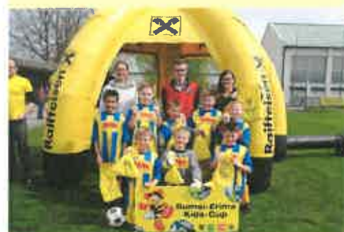
Sumsi-Cup in Dobersberg