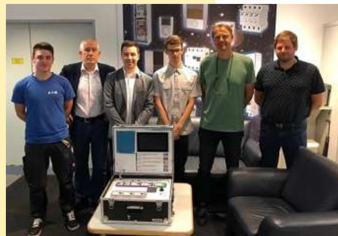
Im Bild: Prüfgeräteübergabe an die Fa. Eaton

Das Schuljahr 2019/20 war für die HTL Karlstein sehr ereignisreich und Covid-bedingt auch ein ganz besonderes. Die Umstellung auf Distance-Learning ging problemlos, da HTL-SchülerInnen sowieso gut mit IT-Equipment ausgestattet sind und auch entsprechend professionell damit umgehen können. Auch vor Corona war es schon üblich, dass SchülerInnen Übungsaufgaben in elektronischer Form erhielten und deren Bearbeitung dann wieder via Fernkommunikation an die LehrerInnen abgaben. Wenn während unterrichtsfreier Tage an Unterrichtsprojekten gearbeitet wird, verwenden die SchülerInnen der HTL-Karlstein schon in der Vergangenheit einschlägige Videokonferenztools, um ihre Informationen entsprechend auszutauschen. So war es auch nicht überraschend, dass alle Kandidatinnen und Kandidaten ihre Reife- und Diplomprüfung ("Matura") bzw. Fachschul-Abschlussprüfung positiv absolviert haben, viele sogar mit ausgezeichnetem Erfolg - alle drei Abschlussklassen konnten mit großem Jubel und im "Babyelefantenabstand" ihre jeweilige weiße Fahne hissen!