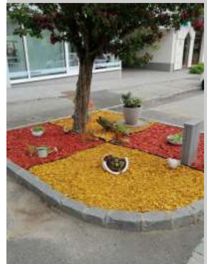
Im Bild: Blumeninseln an der Hauptstraße vor dem Unwetter