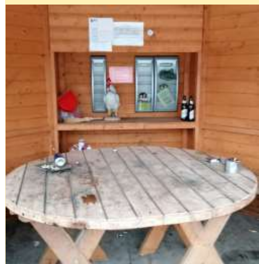
↑ Im Bild: So sieht es manchmal im Pavillon aus!