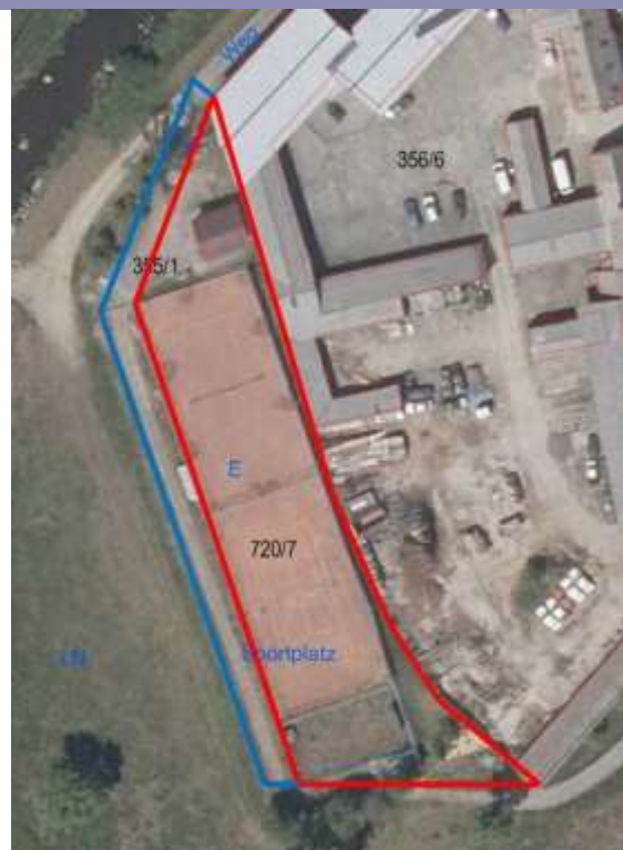
↑ Im Bild: Skizze vom alten Tennisplatz

„Erhalt der alten Volksschule und des dazugehörigen Turnsaals“ in die Tagesordnung der nächsten Sitzung des Gemeinderates aufzunehmen. Der Gemeinderat beschließt den Tagesordnungspunkt in die nächste Gemeinderatssitzung aufzunehmen.