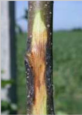
Abb. 1: Verfärbung-Canker