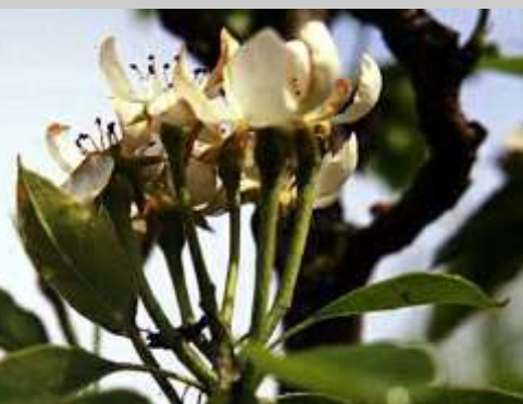
Abb. 3: Befallene Birnenblüte