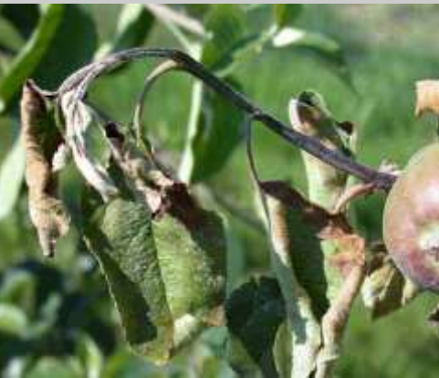
Abb. 2: Hakenförmige Krümmung an Apfel