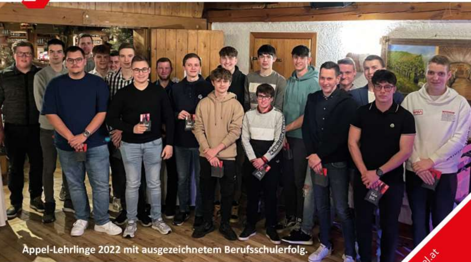
Appel-Lehrlinge 2022 mit ausgezeichnetem Berufsschulerfolg.

„Werde einer von uns“ und hol dir beim Schnuppern deinen Engelbert-Strauß-Gutschein im Wert von € 100,00!