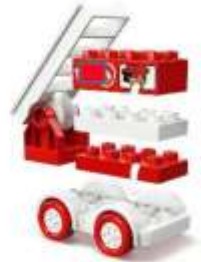
Abbildung 1 Quelle Lego Duplo

Nachdem uns einige am Faschingssamstag schmerzlich vermisst haben, kommen wir Sie im Mai persönlich besuchen. Konkret handelt es sich um eine Spendensammlung, bei der Sie die Gelegenheit haben, Bausteine für unser HLF 3 A 4000 zu erwerben. Nähere Informationen folgen auf unserer Homepage und Facebook sowie als Postwurf an alle Karlsteiner Haushalte.