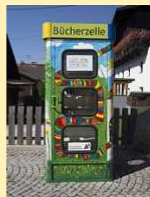
➔ Im Bild: Symbolfoto einer Bücherzelle als Vorbild

Die Telefonzelle in der Hauptstraße in Karlstein hat ausgedient. Deshalb trat A1 Telekom an uns heran, ob diese entfernt werden soll oder die Gemeinde die Telefonzelle übernimmt. Wir haben uns dazu entschlossen, die Telefonzelle zu behalten und sie einer sinnvollen Nachnutzung zuzuführen. Die Telefonzelle soll zur Bücherzelle umfunktioniert werden. Jeder kann Bücher abgeben und / oder Bücher mitnehmen. Kommen Sie bitte mit Ihren Büchern in das Gemeindeamt!