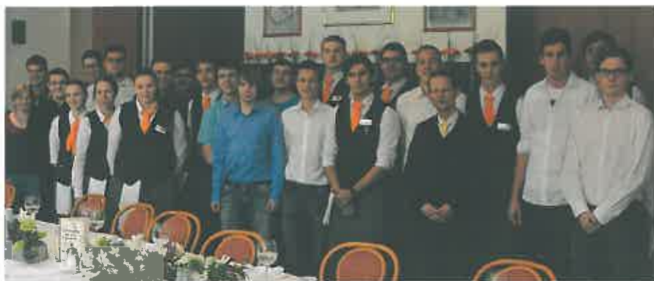
◆ Galaessen mit der LBS Geras