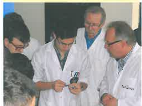
Uhren-Workshop: Fa. Meistersinger