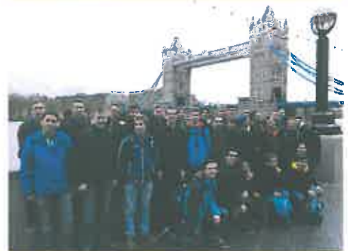
Sprachwoche in England

Ein besonders herzlicher Dank gilt allen jenen Lehrerinnen und Lehrern, welche sich für solche Aktivitäten über das erforderliche Unterrichtsausmaß hinaus engagieren und so nicht nur dem Häuptl-Sager über die nur bis Dienstag arbeitenden Lehrer eine Absage erteilen, sondern auch mithelfen, dass das Bildungsangebot der Waldviertler Schulen eine sehr hohe Qualität aufweist.