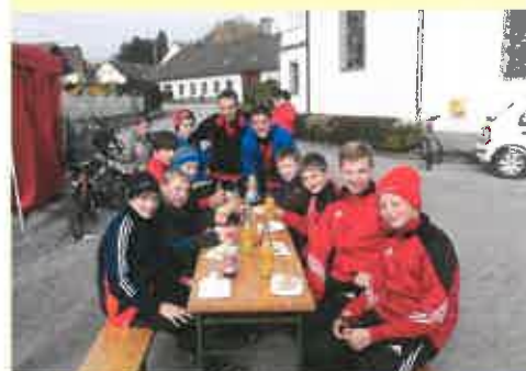
die „USV Juniors“ bei der Jausenstation in Eggersdorf