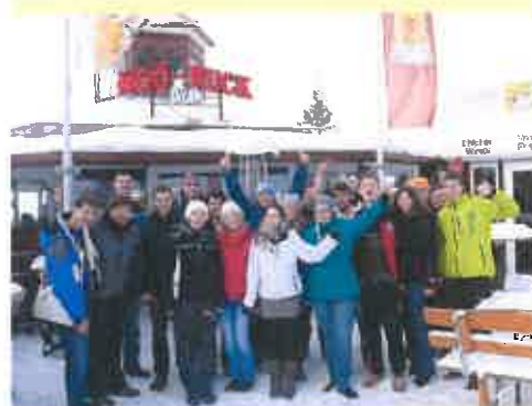
Skiausflug nach Schladming im Februar 2015