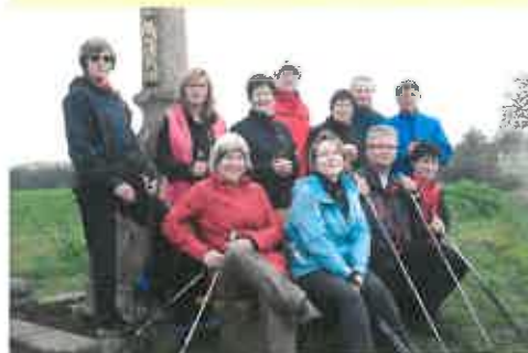
ein Teil der „Walking Gruppe“

Veranstaltet wurde der Wandertag wieder von der Marktgemeinde und dem Union Sportverein Karlstein. Der Sportverein sorgte zu Mittag mit warmen Heurigen-Schmankerln für das leibliche Wohl der Teilnehmer.