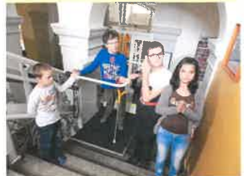
der neue Treppenlift

Die freiwilligen Spenden werden für die weitere Adaptierung der Klasse für schwerstbehinderte Kinder, für Lehrmittel und für Projekttag verwendet.